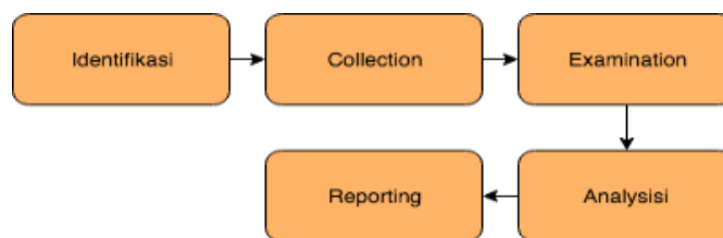
Gambar 1. Metode Live Forensic

Adapun metode penelitian didalam penelitian ini adalah sebagai berikut: