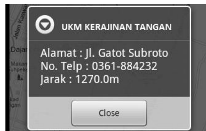
Gambar 5 Tampilan informasi UKM pada halaman peta

Pada halaman peta juga terdapat fitur informasi ,dan jarak UKM dari pengguna (user) dan posisi berupa latitude longitude dari pengguna (user) itu sendiri dengan cara menyentuh marker pada layar . Gambar 5 dan 6 dibawah ini adalah tampilan gambar dari fitur tersebut.