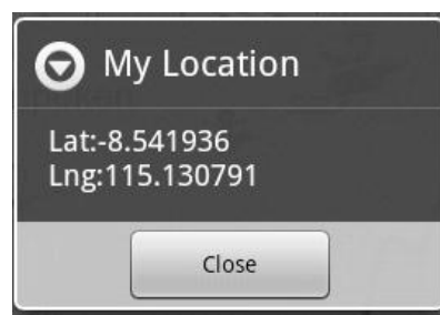
Gambar 6 Tampilan posisi pengguna pada halaman peta

icon.setBounds(0, 0, icon.getIntrinsicWidth(), icon.getIntrinsicHeight()); overlay = new TampilMarker(icon, this); item = new OverlayItem(geopoint, lost_lokasi.get(i).nama_perusahaan, "Alamat : " + lost_lokasi.get(i).alamat + "\nNo. Telp : " + lost_lokasi.get(i).no_telp + "\nJarak : " + distance+"m"); overlay.addItem(item); mapView.getOverlays().add(overlay);