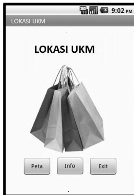
Gambar 3. Tampilan Halaman Utama (Android)

Halaman utama (home) ini merupakan halaman utama yang menampilkan 3 pilihan. Pilihan pertama adalah peta yang berfungsi untuk menampilkan halaman map minimarket. Kedua adalah info berfungsi untuk menampilkan halaman informasi mengenai aplikasi pemetaan UKM tersebut. Ketiga adalah exit yang berfungsi untuk keluar dari aplikasi ini. Gambar 3 dibawah ini adalah tampilan awal halaman user pada saat masuk ke.