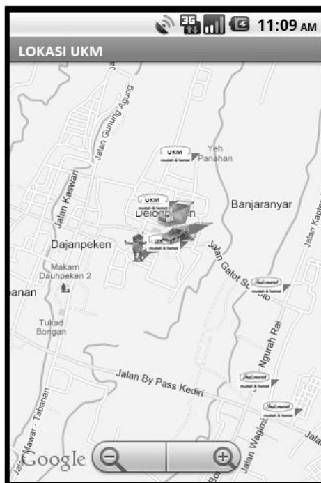
Gambar 4. Tampilan Halaman Peta Pemetaan UKM

Halaman peta pemetaan UKM memberikan informasi mengenai letak gerai UKM di Bali dengan didukung tampilan google map yang mampu memberikan informasi keseluruhan mengenai letak gerai UKM di Bali. Pertama kali membuka halaman map, maka akan ditampilkan marker dari UKM dan marker dari posisi pengguna. Dalam penggunaannya, sistem informasi ini akan dilengkapi dengan fitur zoom in dan zoom out. Gambar 4 dibawah ini adalah tampilan gambar dari halaman peta pemetaan UKM.